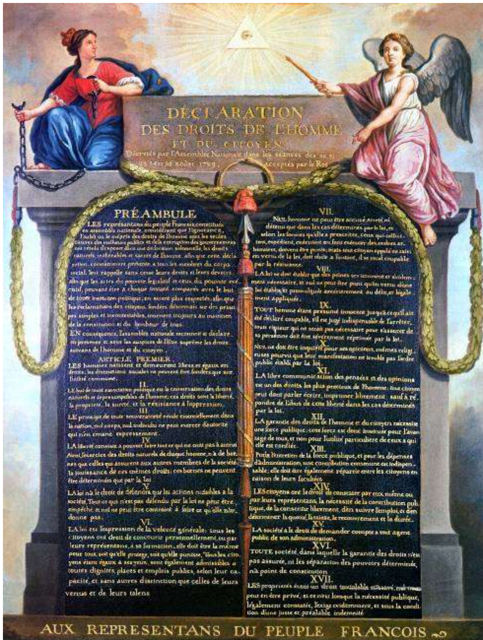
▲ 《人權和公民權宣言》

(Declaration_of_the_Rights_of_Man_and_of_the_Citizen_in_1789)