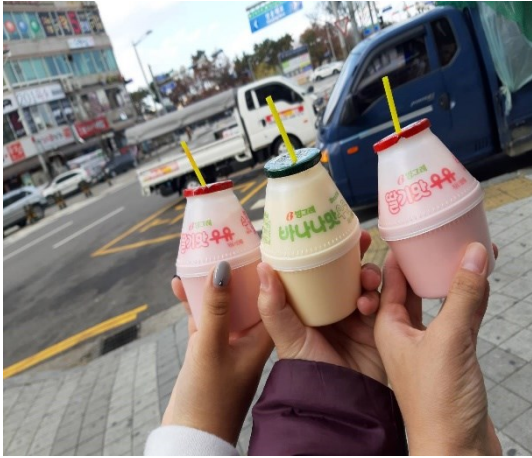
照片 1：第一天到了韓國就馬上 買了肖想很久的草莓牛奶