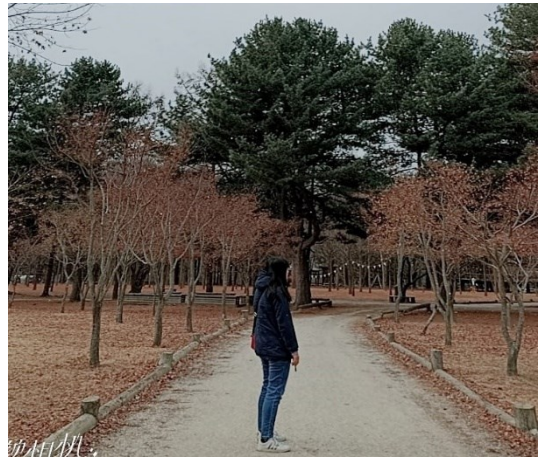
照片 2：去了南怡島，第一次看 到下雪，好冷