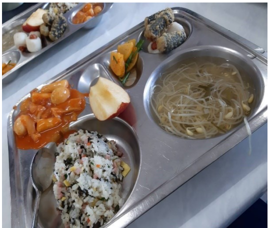
照片 4：學校的午餐很好吃，但 是太多了，有點浪費