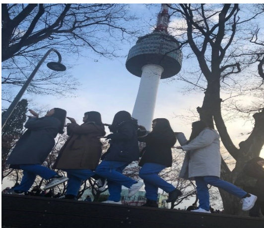
照片 5：首爾的地標首爾塔